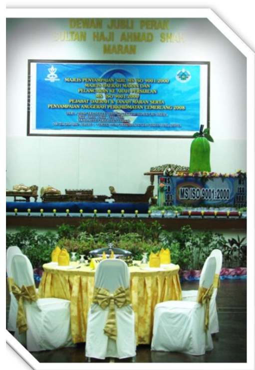
Disediakan oleh : Shahrani Saazai Mat Saad

Seterusnya penyampaian Anugerah Perkhidmatan Cemerlang sesi 2008 kepada 9 kakitangan Majlis Daerah Maran dan 10 orang kakitangan Pejabat Daerah dan Tanah Maran. Mereka telah menerima sijil penghargaan dan juga wang tunai berjumlah RM1000 sebagai tanda penghargaan organisasi terhadap perkhidmatan cemerlang yang telah ditunjukkan.